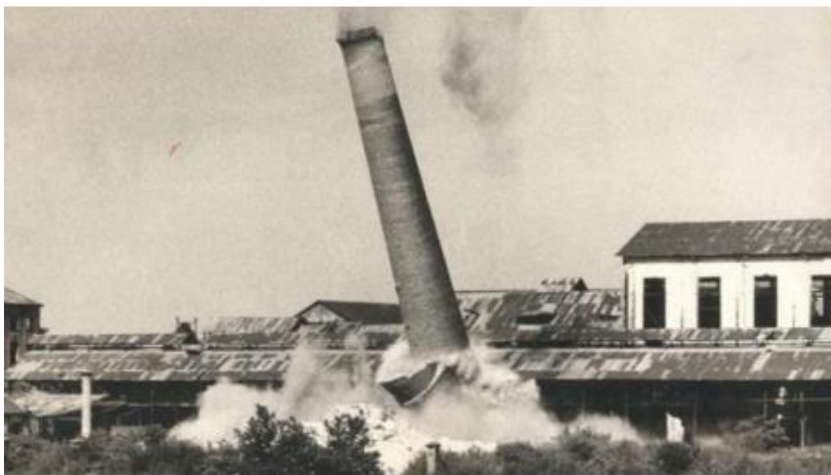
Dinamitación de las chimeneas.