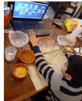
EL MATE ES UNA MEZCLA HETEROGÉNEA