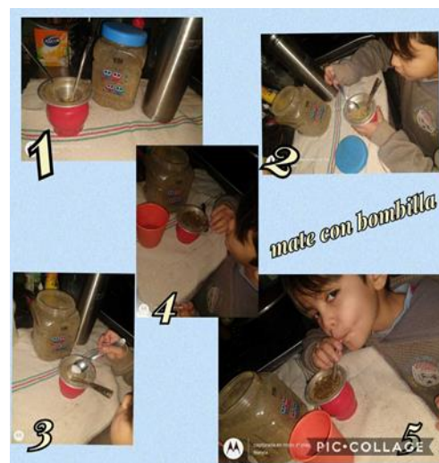
EN CLASE POR ZOOM OBSERVANDO EL MATE COMO MEZCLA HETEROGÉNEA