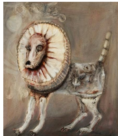
“Jardín de la República”(serie)- Ezequiel Linares /