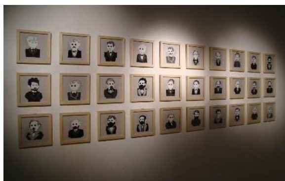
“ Los gobernadores ” (dibujo c/ carbonilla)- Lola Mora