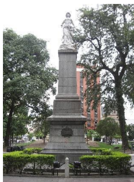
La Libertad (Plaza Independencia/ Tucumán)