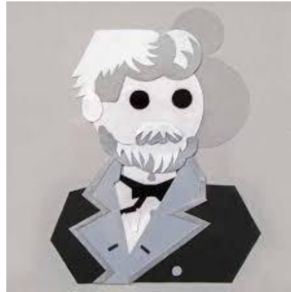
Retrato en collage y acrílicos (Rosalba Mirabella)