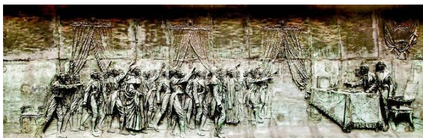
Bajorrelieves de la Casa Histórica sobre la Jura de la Independencia (Tucumán)