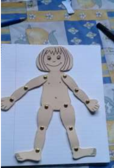
Muñeca articulada realizada por Zoe