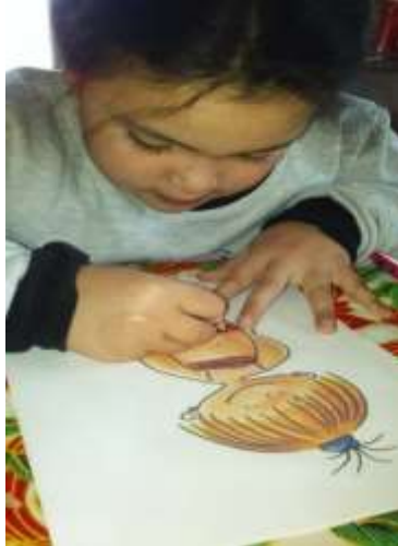
Morena pintando el cuerpo de la nena