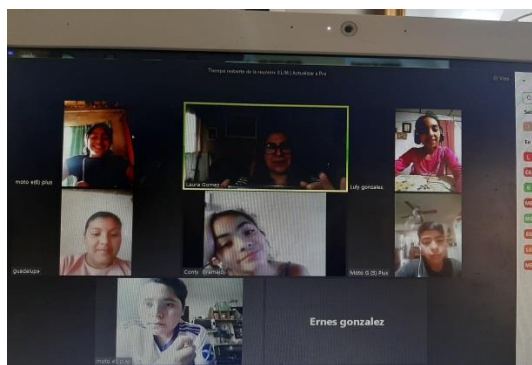
Clases virtual sobre el tema.

A continuación se muestran fotos sobre el Proyecto: