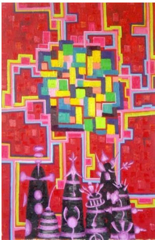
Título: “Serie del verano celestial” – 2008. (Pintura) - Nicolás Leiva

de Tucumán como ORGULLO TUCUMANO. Actualmente vive a tiempo parcial en Faenza, Italia, donde trabaja con una variedad de materiales en los talleres de Bottega Gatti. Presentó exposiciones individuales y colectivas importantes en los Estados Unidos y en otras instancias internacionales. Actualmente sus obras se encuentran en las colecciones permanentes del Museo de Arte Latinoamericano de Buenos Aires (MALBA), el Museo de Arte Snite de la Universidad de Notre Dame en Indiana; la Colección Berardo en Lisboa, la Colección Gollinelli en Bolonia y la colección del Museo de Arte de Fort Lauderdale en Florida.