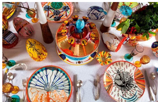
detalle Mesa del comedor.