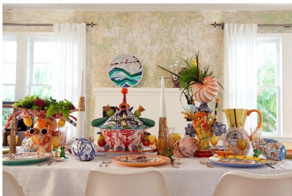
Mesa del comedor

Leiva es conocido por sus exuberantes esculturas y pinturas. Pero es más conocido aún por sus fantasmagóricas creaciones de cerámica. Animales y vegetales, formas abstractas, carruajes voladores y cabezas humanas se transforman en cerámica en una explosión de colores primarios grabados en plata y oro. Como una botella de Klein o una tira de Möbius, su mundo imaginativo se despliega ante nosotros en infinitos reinos. Muy gestual, orgánico o geométrico, Leiva presenta una serie de arquetipos en sus emblemas de vuelo, seguridad y deleite.