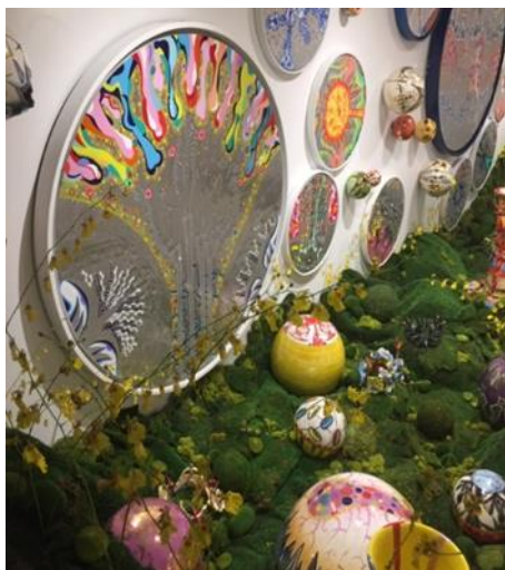
El artista y su obra: Instalación de Jardín tropical de Invierno-2018