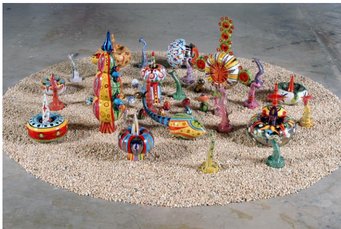
Autos, motos, instalación