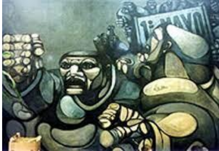
Primero de Mayo (S.O.I.V.A) 1963 – Ricardo Carpani